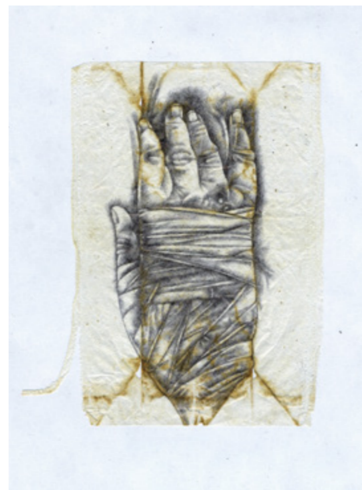
Volker Schlecht teabag – hand with bandage www.drushbapankow.de